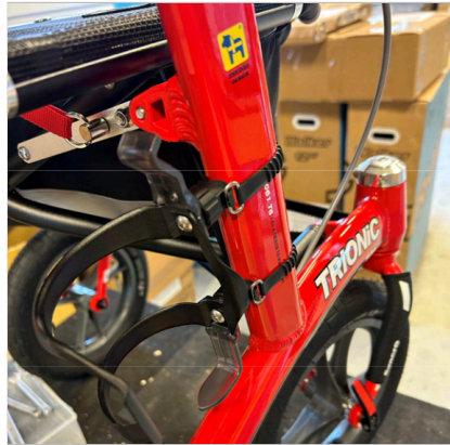
⑧ Pullonpidike on nyt kiinnitetty runkoon ja pullo asetetaan sisään sivulta ja poistetaan ulospäin.