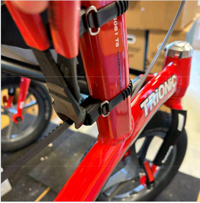
⑤ Kiinnitä toinen pidike samalla tavalla.