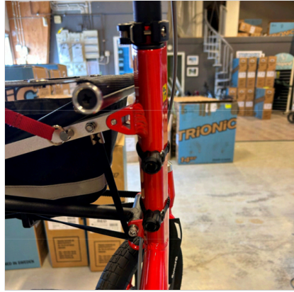
⑥ Kaksi pidikettä on koottu oikein runkoputkeen.