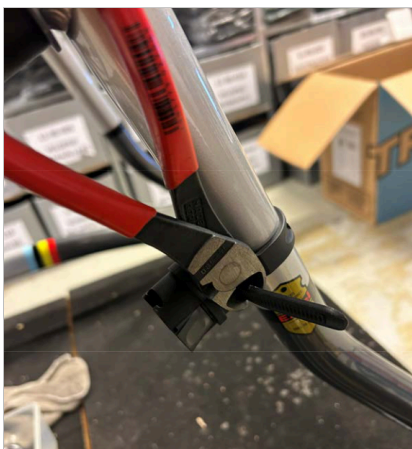
⑦ Leikkaa hihnan ylimääräinen pituus pois kaapelileikkurilla tai veitsellä.