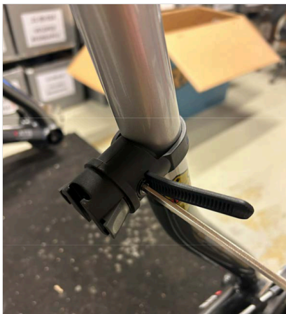
⑥ Kiristä ruuvia/hihnaa 4 mm:n kuusiokoloavaimella, kunnes hihna on tiukka.