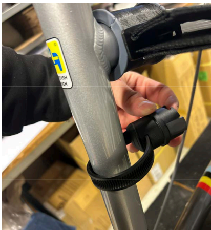
⑤ Työnnä hihnan pää kiinnikkeeseen.