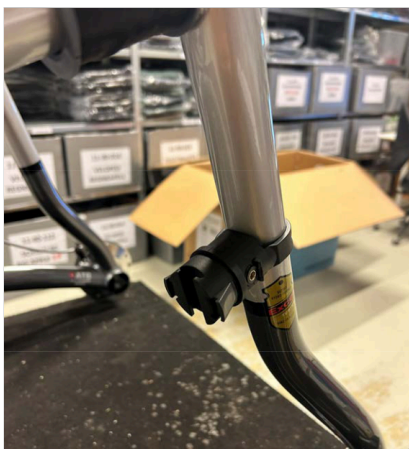
⑧ Kuvassa näkyy telineen oikea kiinnitys.